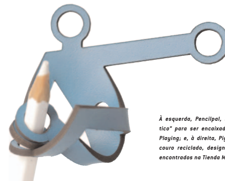
À esquerda, Pencilpal, bonequinho "acrobático" para ser encaixado no lápis, da série Playing; e, à direita, Piggy Bank, ambos em couro reciclado, design Vacavaliante, todos encontrados na Tienda Malba