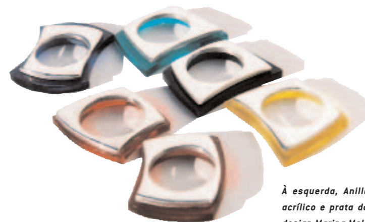
À esquerda, Anillos, anéis em acrílico e prata da série CMYK, design Marina Molinelli Wells; e, à direita, Pequeño Señor e Cajitas, broches em prata de Rita Hampton