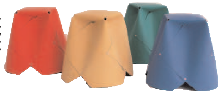
Acima, bolsa Dangerous Beauty, produto da série Peleteria Humana, em couro, design Nicola Constantino, da coleção da Tienda Malba. Ao lado, banqueta Circus Stool, design Alejandro Sarmiento, em cartão e laminado plástico, estruturado com rebites