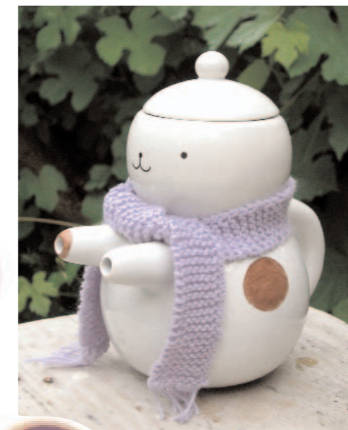
Acima bule Tetera, da série de utilitários de Lola Goldstein, em cerâmica com cachecol em tricô. À esquerda, Cherry 3, da série de colares do estúdio Perfectos Dragones, em PVC e metal, à venda na Tienda Malba